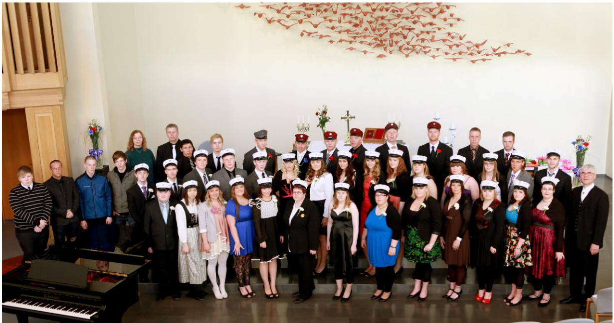
Útskriftarnemar ásamt stjórnendum skólans í Ísafjarðarkirkju 22. maí 2010