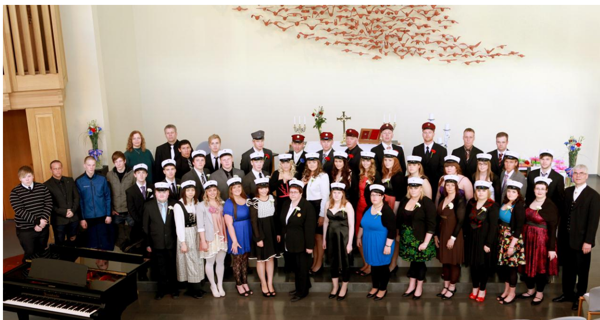
Útskriftarnemar ásamt stjórnendum skólans í Ísafjarðarkirkju 22. maí 2010