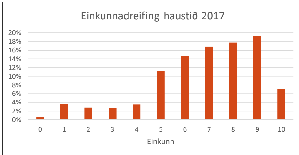
Mynd 7.1.a. – Einkunnadreifing haustannar 2017

Í sjálfsmatsskýrslu fyrir skólaárið 2013-2014 er að finna samanburð á einkunnadreifingu, sundurliðað efir önnum, sem nær frá vorönn 2008 til vorannar 2014. Niðurstöður sýndu að full ástæða væri til að halda áfram að skoða niðurstöður úr áföngum með tilliti til breyttra kennsluhátta (leiðsagnarmats). Á myndunum 7.1.a. og 7.1.b má sjá einkunnadreifingu lokamats haustannar 2017 og vorannar 2018.